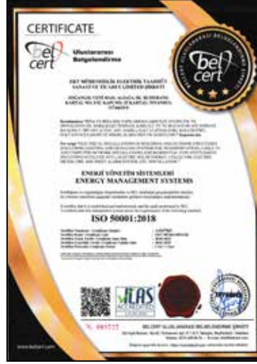
ISO 50001:2018 Enerji Yönetim Sistemleri Energy Management Systems