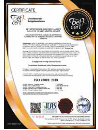
ISO 45001:2018 İSG Yönetim Sistemleri OHS Management System