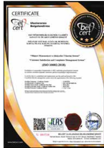
ISO 10002:2018 Müşteri Memnuniyeti ve Şikayetleri Yönetim Sistemi Customer Satisfaction and Complaints M. System