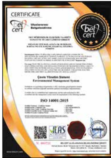
ISO 14001:2015 Çevre Yönetim Sistemi Environmental Management System