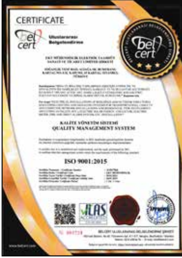
ISO 9001:2015 Kalite Yönetim Sistemi Quality Management System